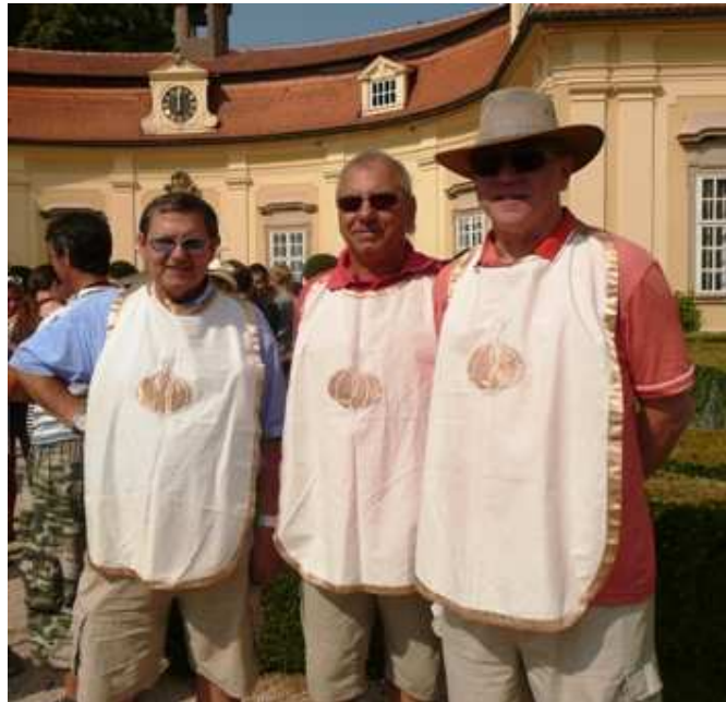
Tři mušketýři z CCC Bratislava