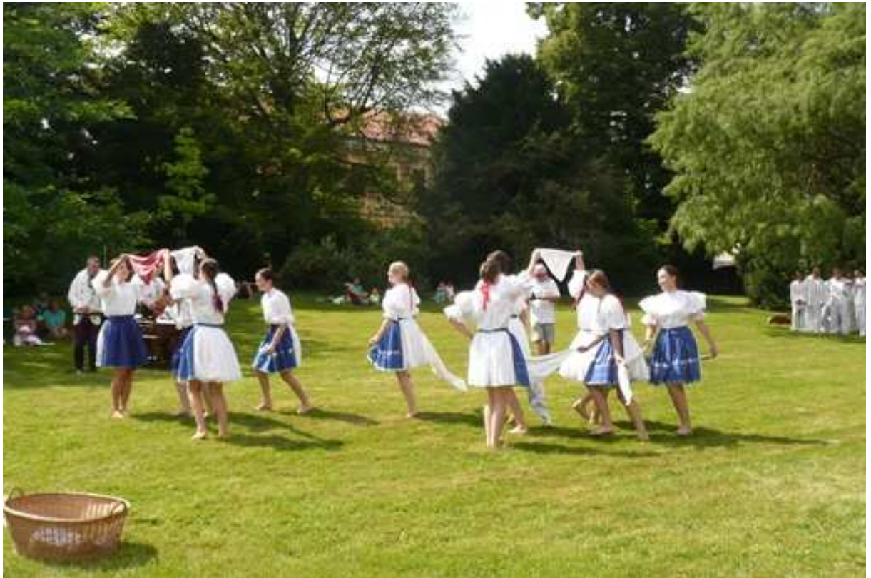
Radostné tancování souboru Dúbrava