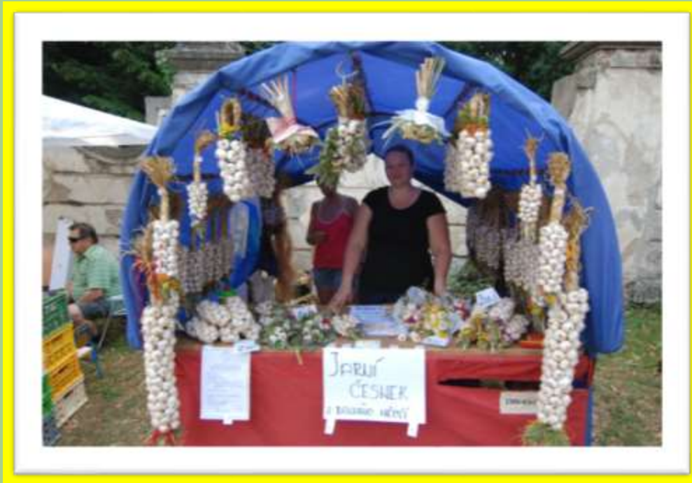
Barevný a voňavý stánek z Dolního Němčí