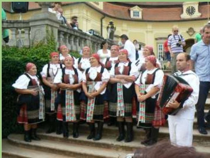
Ženský sbor Dolinečka ze Soblahova, SR