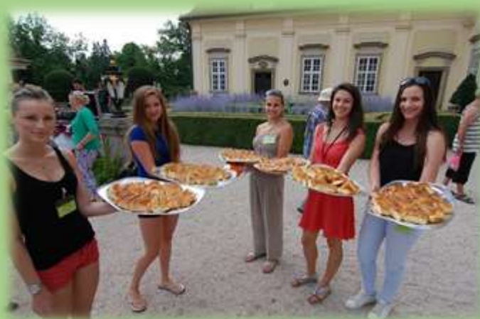
Česnekové inspirace FAB