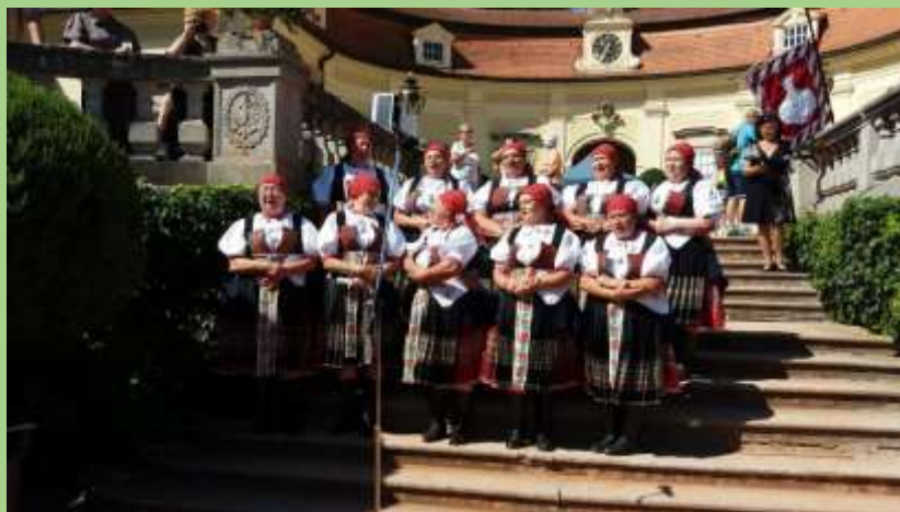
Ženský sbor Dolinečka ze Soblahova, Slovensko