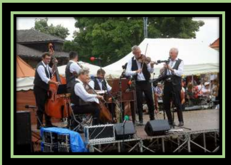
Muzika Rabi Gabi, která doprovázela tanečnický z Hradišťanu