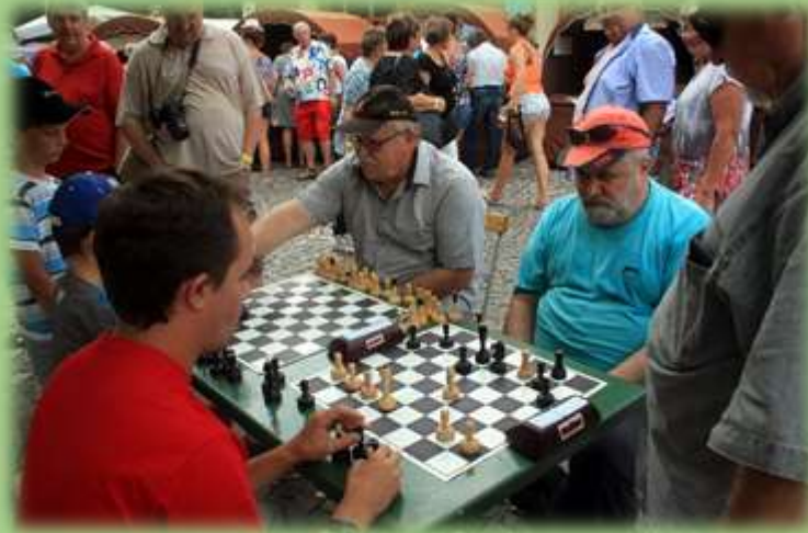
Šachové utkání Boršice – Svět