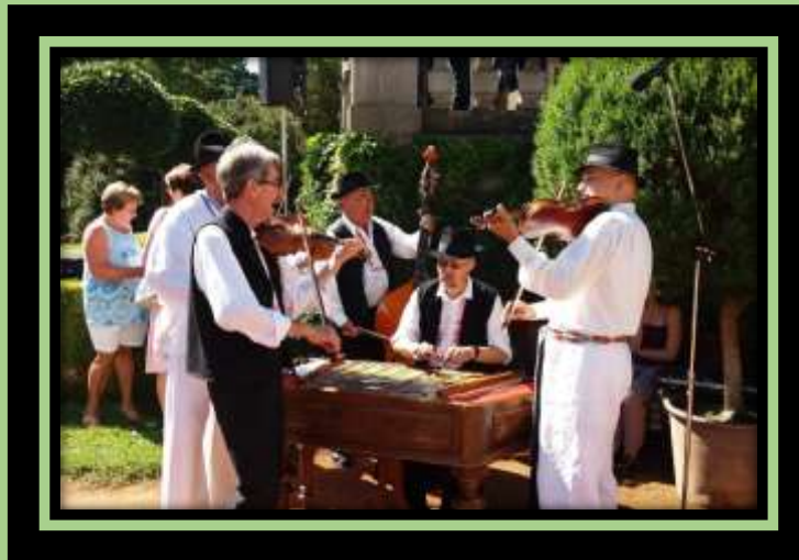
Cimbálová muzika BURČÁCI z Míkovic – klasika Festivalu česneku 2018