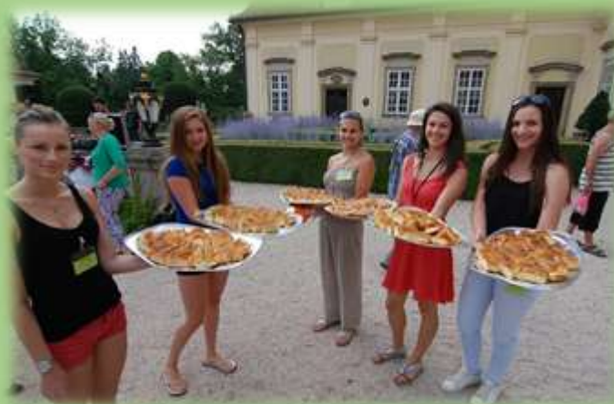
Česnekové inspirace Folklorní agentury Buchlov