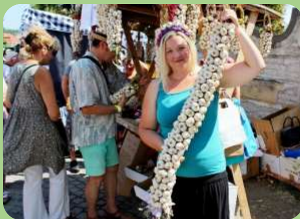
Barevný a voňavý stánek z Dolního Němčí