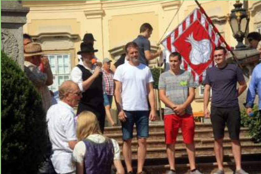
Spolupracovníci – viz. výše