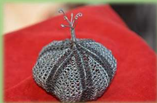
Dar CCC Bratislava organizátorům festivalu česneku 2018